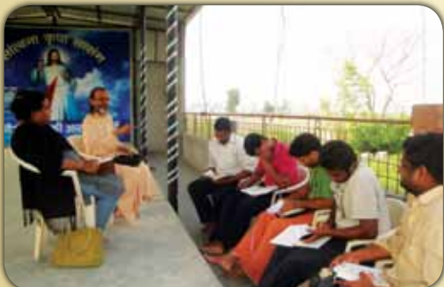
ഡൽഹി അതിരൂപതയിലെ സെമിനാരിൽനിന്നുവേണ്ടി നടത്തിയ ഡീക്കൺപട്ട് ഒരുക്ക ധ്യാനം