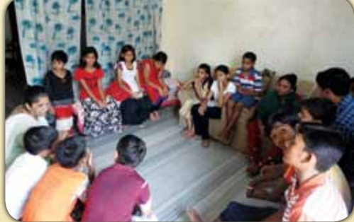
ആഗ്രയിൽ ആദ്യകൂർബാന സ്വീകരിക്കുന്ന കുട്ടികൾക്കുവേണ്ടി നടത്തിയ ഒരുക്ക സെമിനാറിൽ നിന്ന്