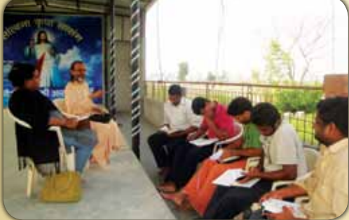
ഡൽഹി അതിരൂപതയിലെ സെമിനാരിൽനിന്നുവേണ്ടി നടത്തിയ ഡീക്കൺപട്ട ഒരുക്ക ധ്യാനം