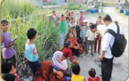
ചെന്നൈയിൽ നിന്നുള്ള ജീസസ് യൂത്തിനുവേണ്ടി സാന്ത്വന കമ്മ്യൂണിറ്റി ഡൽഹിയിൽ സംഘടിപ്പിച്ച മിഷൻ ഔട്ട്റിച്ച്യിൽ നിന്ന്