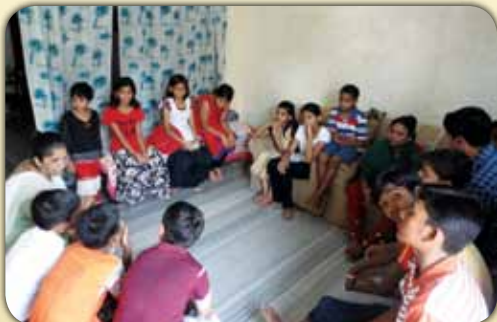
ആഗ്രയിൽ ആദ്യകൂർബാന സ്വീകരിക്കുന്ന കുട്ടികൾക്കുവേണ്ടി നടത്തിയ ഒരുക്ക സെമിനാറിൽ നിന്ന്