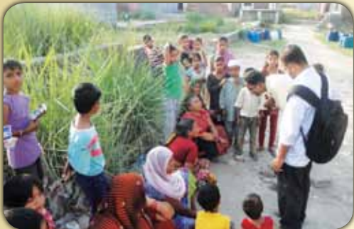
ചെന്നൈയിൽ നിന്നുള്ള ജീസസ് യൂത്തിനുവേണ്ടി സാന്ത്വന കമ്മ്യൂണിറ്റി ഡൽഹിയിൽ സംഘടിപ്പിച്ച മിഷൻ ഔട്ട്റിച്ച്യിൽ നിന്ന്